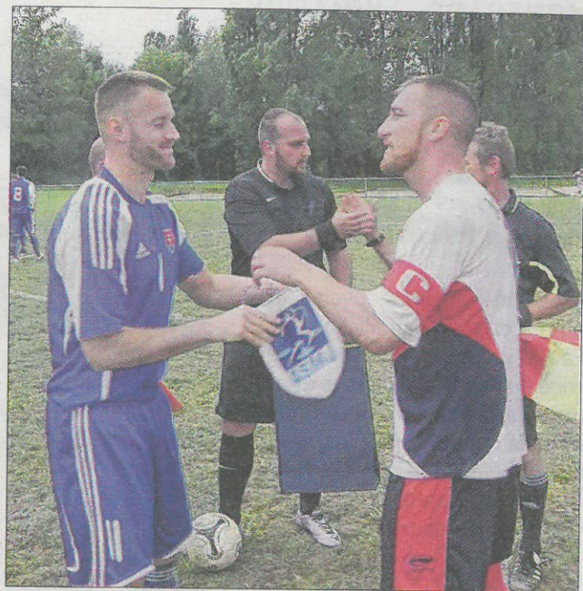
es ont donné lieu à des belles confrontations.