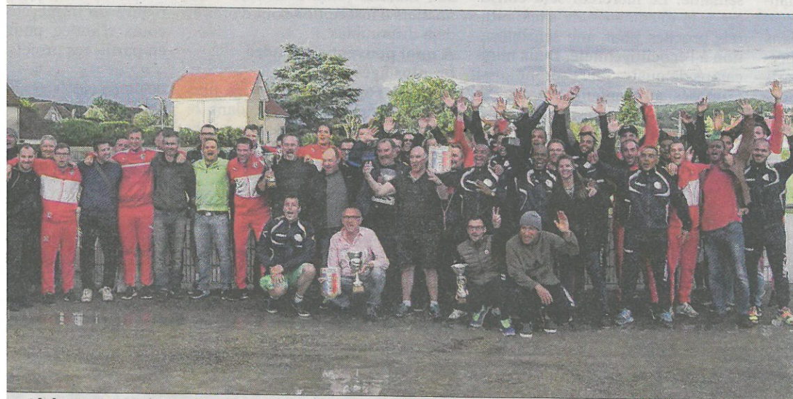
es délégations conviées à ce grand rassemblement sportif européen.